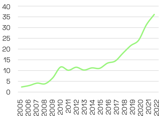
PiezoMotors intäkter från produktförsäljning (MSEK)

Under året har koncernen haft goodwill-avskrivningar på 119,8 MSEK (21,2) som härrör från bolagsförvärven under 2021. Dessa redovisas som Kostnad för sålda varor och påverkar således bruttorisultatet. Övriga avskrivningar uppgick under perioden till 6,2 MSEK (3,8).